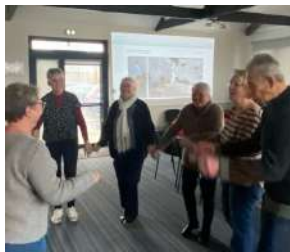
+ De nouvelles visites sont désormais disponibles.

Au programme : quiz musical, chansons aux refrains bien connus, quelques danses bretonnes ! Ainsi que du café, du cidre, du jus de pomme et des gâteaux offerts par le CCAS.